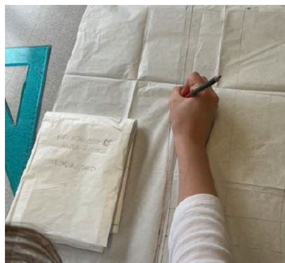
Realizzazione dei cartamodelli