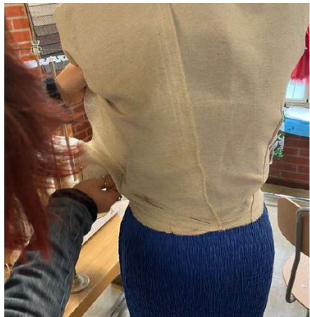
Confezione dei capi d'abbigliamento e prove su manichino