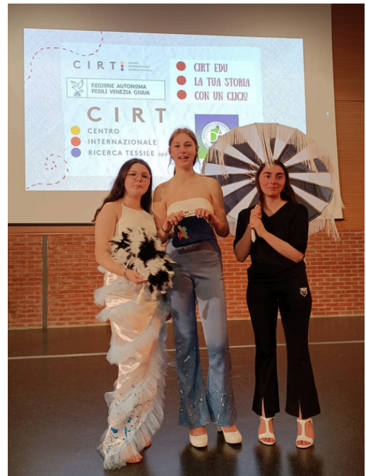
Sfilata finale dei modelli prodotti