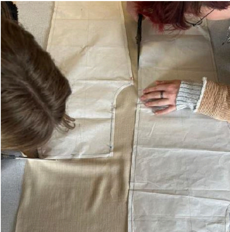
Piazzamento su stoffa e taglio