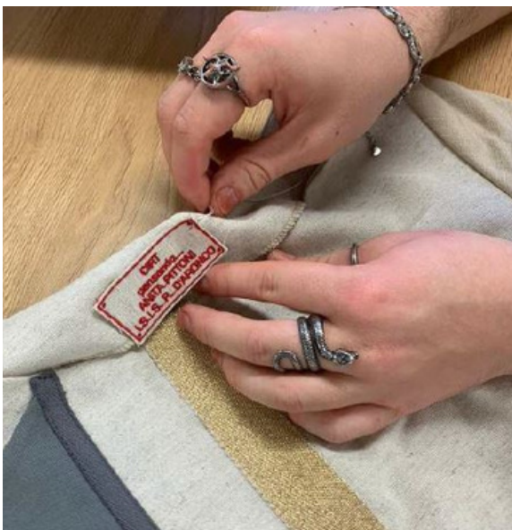
Confezione degli accessori e finiture dei capi d'abbigliamento